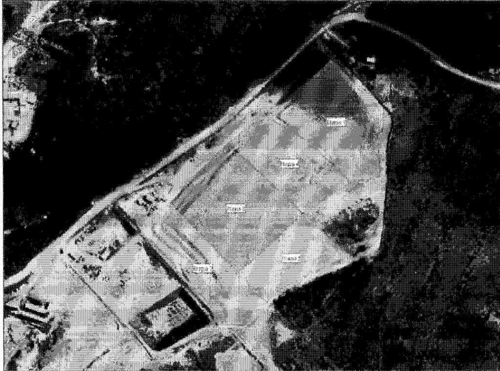
Figura N°1: Croquis de colocación de geomembrana por etapas.