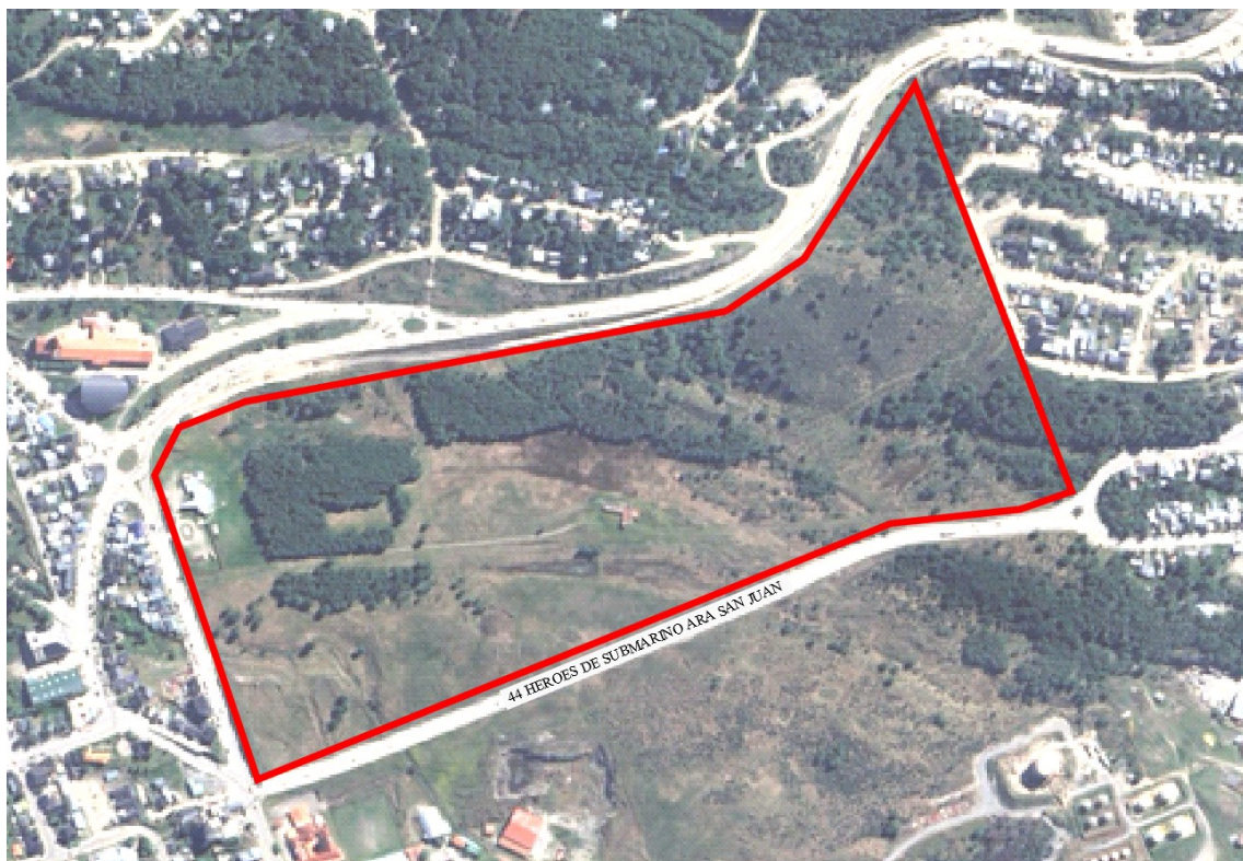
Ilustración 1: Polígono de la creación "Parque Recreativo Base Naval Ushuaia" y designación de nombre de calle a la vinculación entre Yaganes y Facundo Quiroga.

En el caso de la parcelas ubicada en la Sección E del Macizo 2 , tenemos como antecedentes dos ordenanzas municipales vigentes, una de ellas, la Ordenanza Municipal N° 5071/2016, que crea un "Parque Recreativo Base Naval Ushuaia", un lugar recreativo, de esparcimiento y un pulmón ecológico para la ciudad. Y la Ordenanza Municipal N° 5421/2018, designándole el nombre "44 Héroes del Submarino ARA San Juan" a la vinculación vial entre las calles Yaganes y la Avenida Facundo Quiroga.