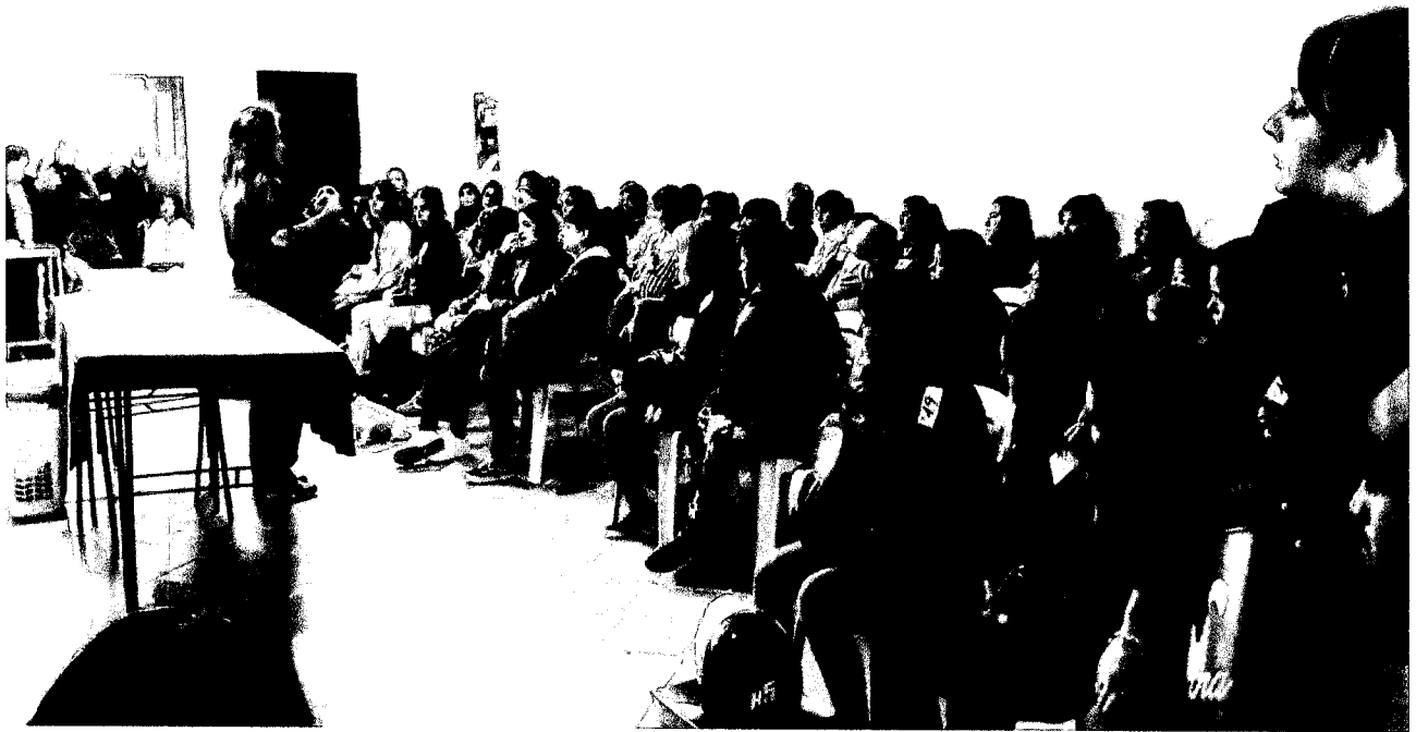
Archivo Almirante Brown – Septiembre 2019.

Los Programas de Salud Pública no pueden suspenderse.