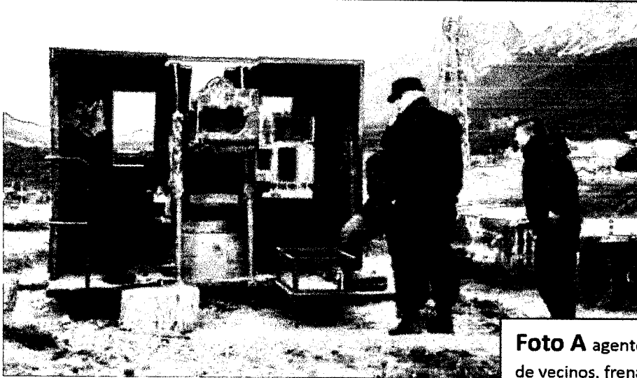
Foto A agentes responden a denuncia de vecinos, frenando el retiro d el cañón

COMPARACIÓN del Tratamiento de patrimonio histórico a nivel local,( foto A y A´)con el tratamiento que se le da a su sitio equivalente de Pto Toro , en Chile, (aparición en diferentes medios en chile) en foto C.