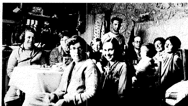
Naufragos en casa de los Abuelos, la noche del Naufragio

Fueron vecinos comprometidos con su comunidad y participaron activamente, en la vida social, cultural y política de la pequeña población, durante el mes de Enero de 1930, el día del naufragio del Monte Cervantes el espíritu solidario de todos los vecinos de esa Ushuaia albergó a gran parte de los sobrevivientes de esta tragedia en sus hogares, los abuelos también recibieron a dos familias de naufragos en su casa, a pesar de ser una familia numerosa.