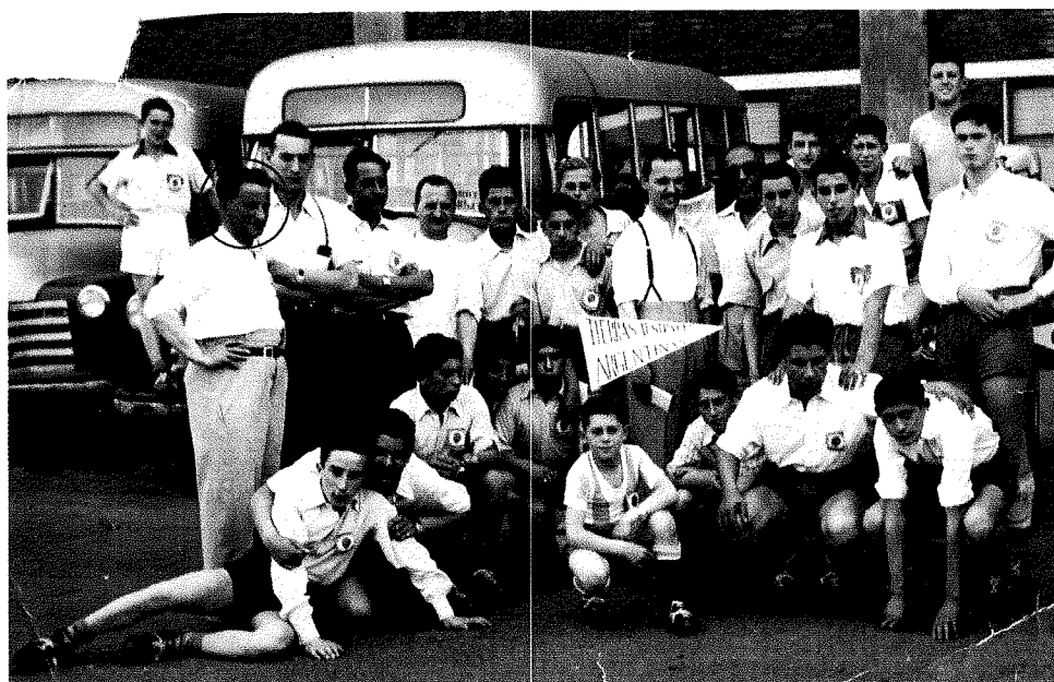
Delegación de jovenes Fueguinos representando al Territorio en Campeonato EVITA año 1950

EL ABUELO presidió la delegación "TIERRAS AUSTRALES ARGENTINAS", la inauguración del evento se realizó en el Club River Plate, con la presencia de Perón y Evita.