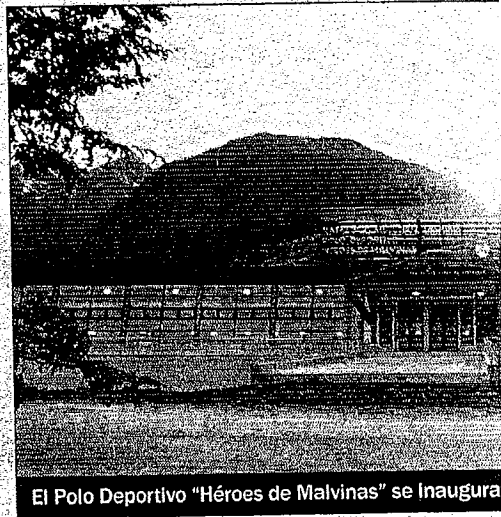
El Polo Deportivo "Héroes de Malvinas" se inaugura