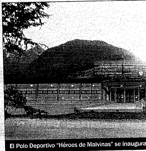
El Polo Deportivo "Héroes de Malvinas" se inaugura mañana.