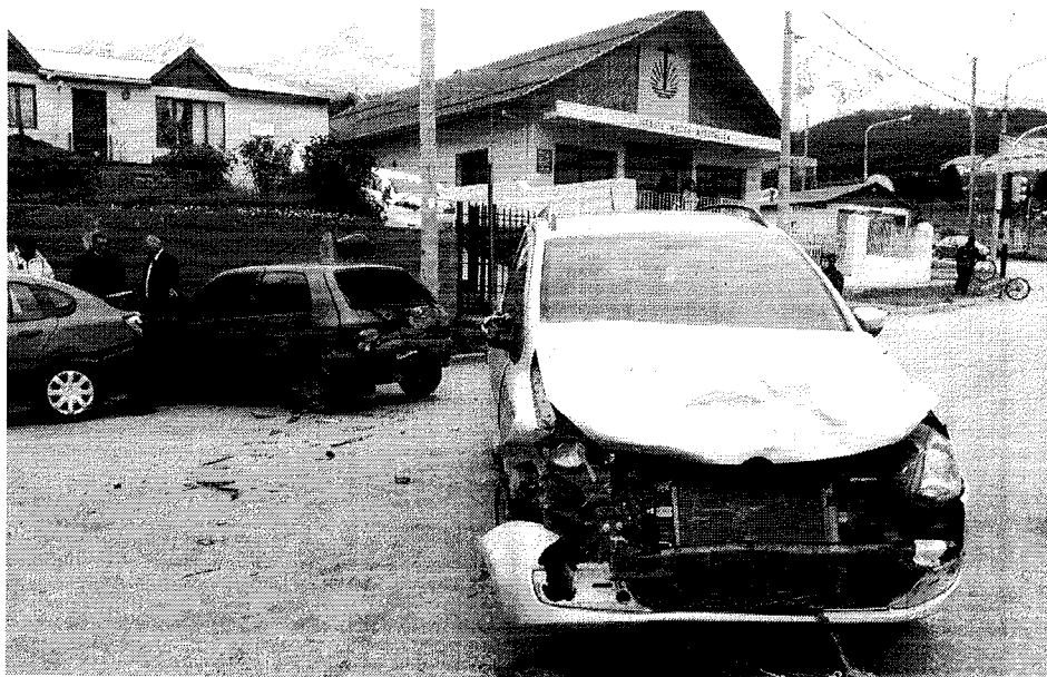
Fotos del último accidente, acaecido el día 23/02/14 en horas de la mañana. Vista desde la calle Marcos Sar.