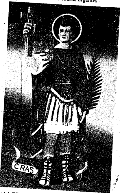
LA ESPERANZA DEL NUEVO MILENIO

La p dad, nas, que nas sup cua Art. Toc pre Le sec tal dia Ar